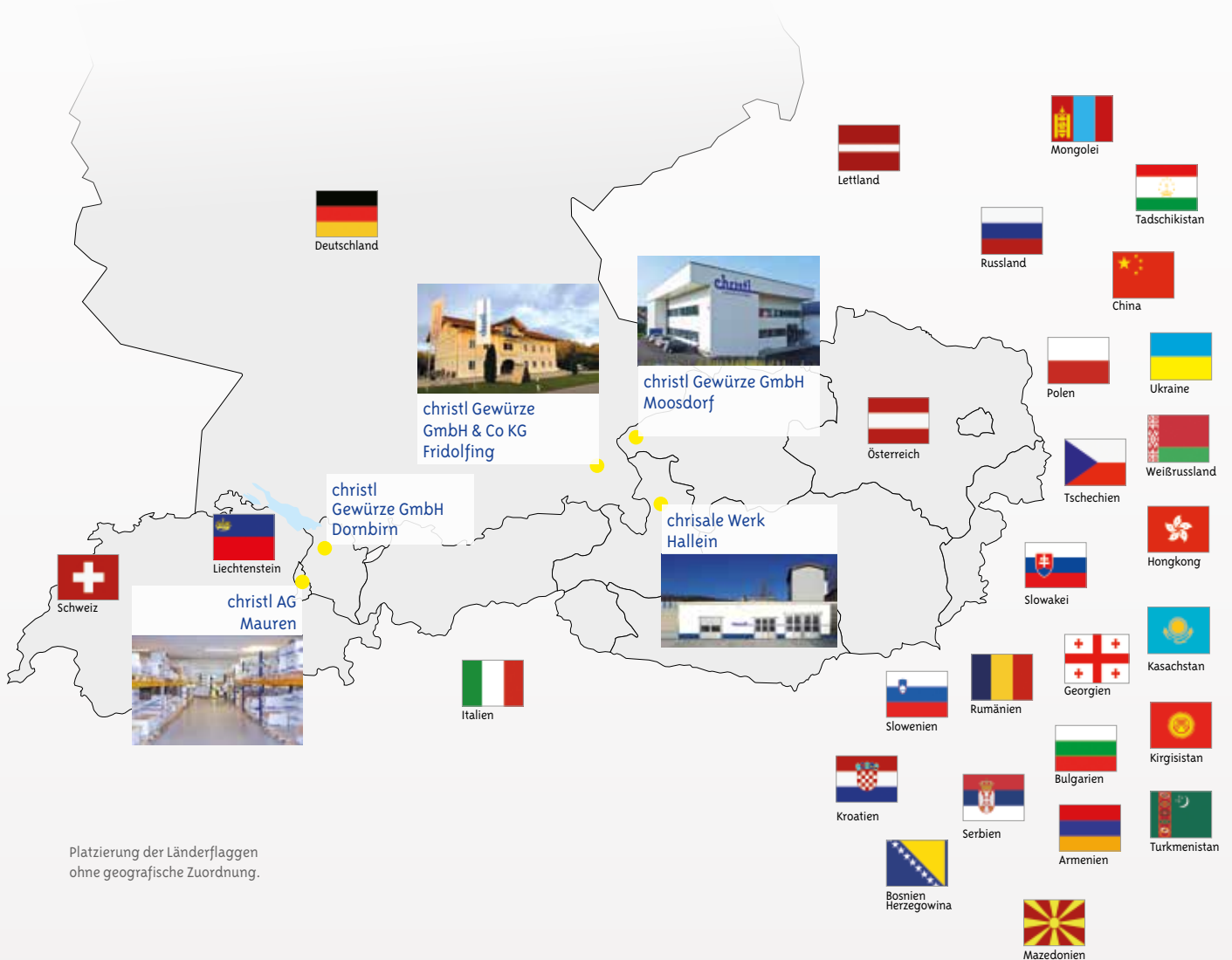
Platzierung der Länderflaggen ohne geografische Zuordnung.

Wir gehen auf die Bedürfnisse unserer Kunden ein, denn jeder Markt und jedes Land hat seine eigene Würze.