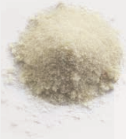
122034 Selchfleisch Combi-Rustikal