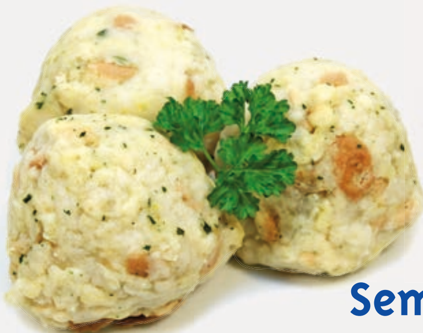
154003 Semmelknödel Quick