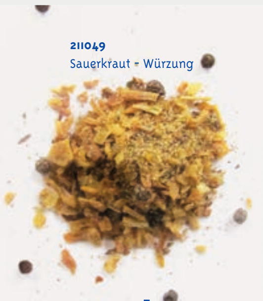
211049 Sauerkraut - Würzung